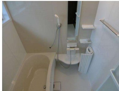
浴室 現地(2021年8月)撮影