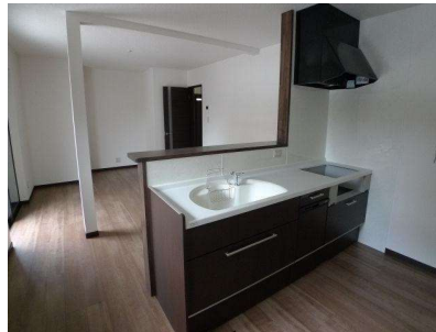
リビング 現地(2021年8月)撮影